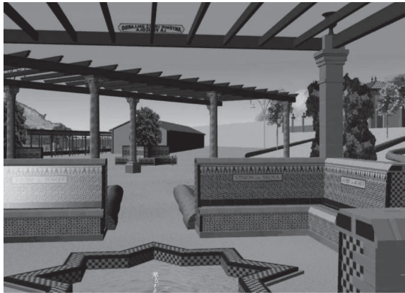
Fig. 5: Reconstrucción virtual de la “Fuente del Vino”.

Esta construcción enseguida gozó de gran popularidad, convirtiéndose en obra significativa del balneario y siendo fondo de numerosas fotografías y postales representativas de este lugar.