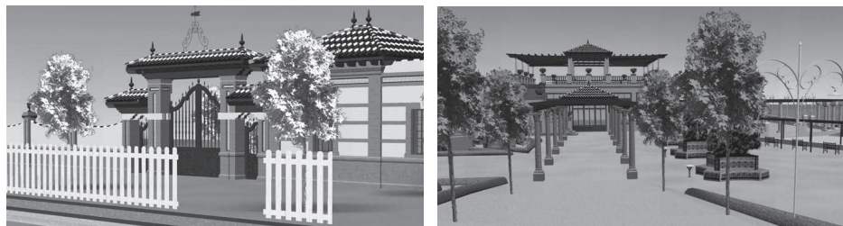
Fig. 2: Reconstrucción virtual de la portada de acceso al balneario.

Las pilastras están realizadas en fábrica de ladrillo visto con línea vertical de azulejo encastrado con motivos zoomoráficos, rematadas con piezas de ladrillo en forma escalonada, donde se intercalan hiladas de ladrillo vitrificado en color azul e hiladas de piezas con canto de perfil y canto de talón. Cada pilastra va encumbrada por ánforas cerámicas vitrificadas en color azul.