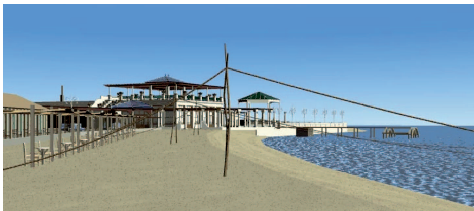
Fig. 4: Reconstrucción virtual del edificio del restaurante y la terraza. Vista desde la playa.

se prolongan al suelo hasta topar con el remate inferior del pretil, simulando dos columnas de ladrillo de un pie de espesor aderezadas por una secuencia repetitiva de dos hiladas más una resaltada.